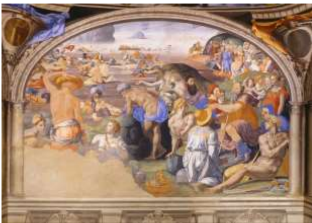
חציית ים סוף, פרסקו מאת אניולו ברונזינו, פאלאצו וקינו, פירנצה

יש שטוענים שגודל האוכלוסייה המצרית הכתוב במקרא מופרך. לפי אומדנים שונים כמות הגברים במצרים העתיקה לא הייתה הרבה יותר משישים ריבוא, טענה שלכאורה סותרת הקביעה המקראית שששים ריבוא גברים יצאו ממצרים. אולם הנתונים לגבי גודל האוכלוסייה במצרים מבוססים על השערות בלבד והם יכולים לתת אומדן בלבד. קשה מאוד להעריך גודל אוכלוסייה עפ"י טקסטים עתיקים, האומדן נעשה עפ"י כתובות מקברי פרעונים וממקדשים שסיפקו מידע על מספר העובדים שהועסקו בפרויקטים של הבנייה. רשימות