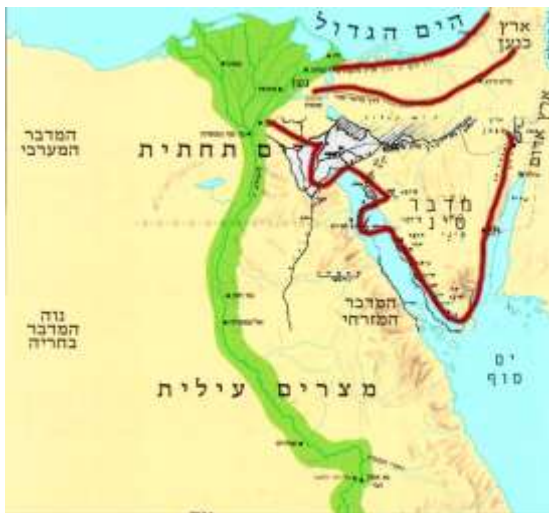
מסלולי הנדידה המוצעים עפ"י הטקסט המקראי (שמות פרקים א'-ט"ז)

האם בתנאים המדבריים של סיני לא נשתמרו ממצאים המצביעים על ראיות נדידת בני ישראל ועל כן לא זוהו האתרים המוזכרים בתנ"ך? ישנם אתרים שזוהו על סמך מסורות דתיות, ולא על סמך הוכחות ארכיאולוגיות, ייתכן שחלק מהאתרים שזוהו כיום אינם האתרים המקוריים המוזכרים בתנ"ך. או שעדיין לא נמצאו ראיות, האם יש סבירות שימצאו בעתיד?