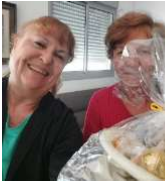
דולי הביאה לאתי קול