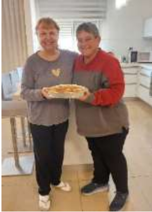
אקלה הביאה לדולי