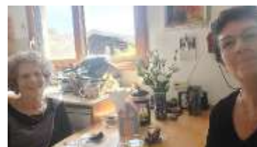
ערטל רילסקי הביאה לחיה ישפה